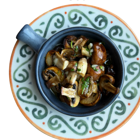
CHAMPIÑONES A LA PLANCHA 150g Šampinjoni sa roštilja u marinadi od belog luka 650