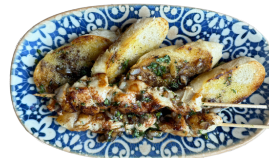
PINCHO DE POLLO 100g Ražnjići piletine sa chimichuri sosom 510