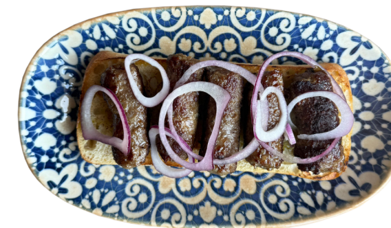
MADRE MÍA! 150g Ćevapi od junećeg mesa 580