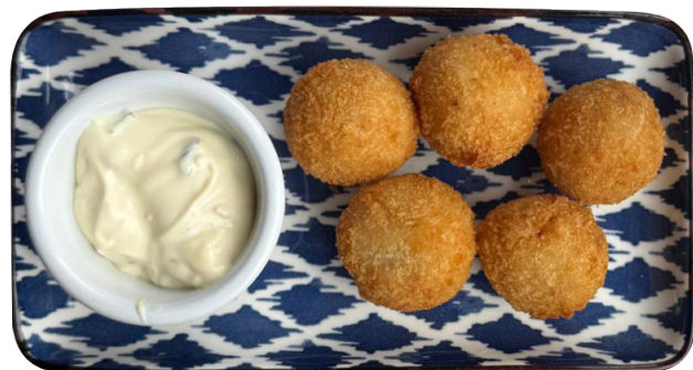
CROQUETAS DE JAMÓN 150g Kroketi od piletine i španske pršute Jamón Ibérico Gran Reserva sa ajoli sosom 750