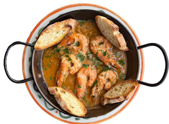
GAMBAS A LA MARINERA Gambori u beloj buzari 790