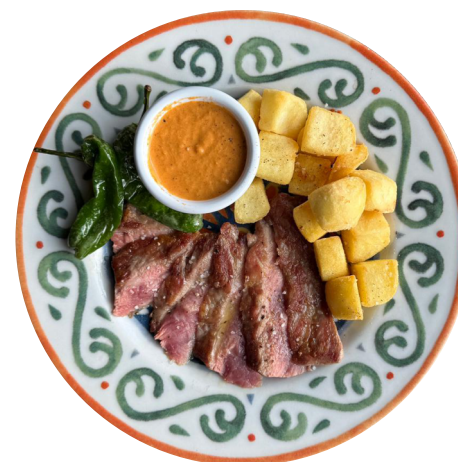
IBÉRICO PLUMA Meso iberijske svinje (pata negra) koje se proteže od krajnjeg dela vrata do početka filea, servirano uz Padrón paprike i patatas bravas 1640