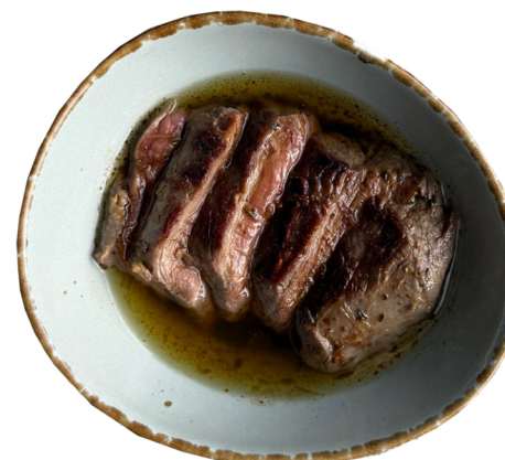
BIFTEK U ULJU 150g 1590