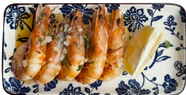
GAMBAS A LA PLANCHA Gambori na roštilju 790