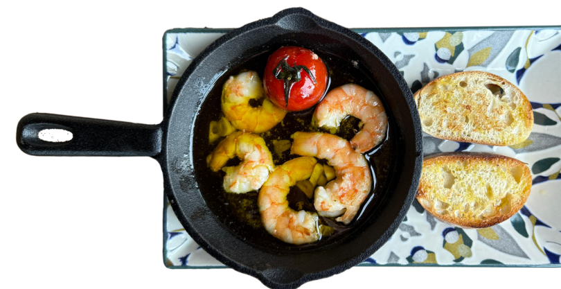
GAMBAS AL AJILLO 150g Kozice u belom luku i maslinovom ulju 790