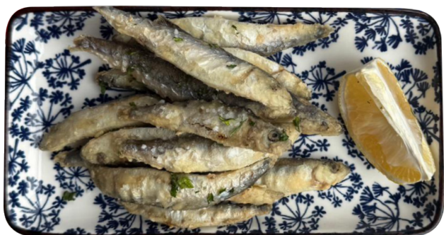
PESCADITOS FRITOS 150g Frigane girice 390