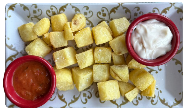
PATATAS BRAVAS Prženi krompiriči sa domaćim pikantnim umakom i ajoli sosom 460