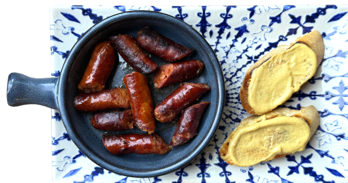
CHISTORRA 150g Domaća kobasica 540