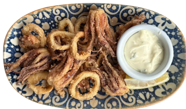
CALAMARES FRITOS 120g Frigane lignje sa ajoli sosom 680