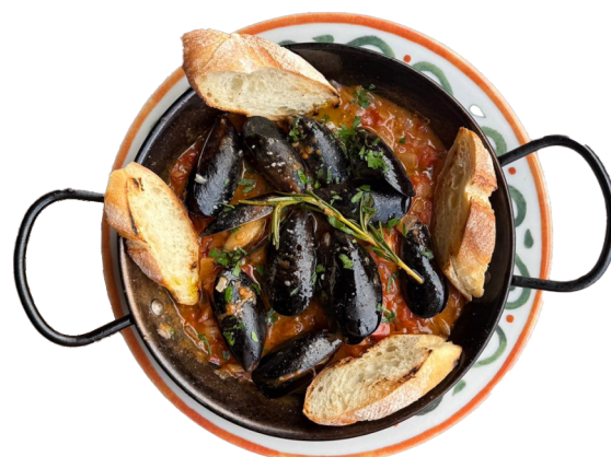
MEJILLONES PICANTES Dagnje u pikantnom crvenom sosu 690