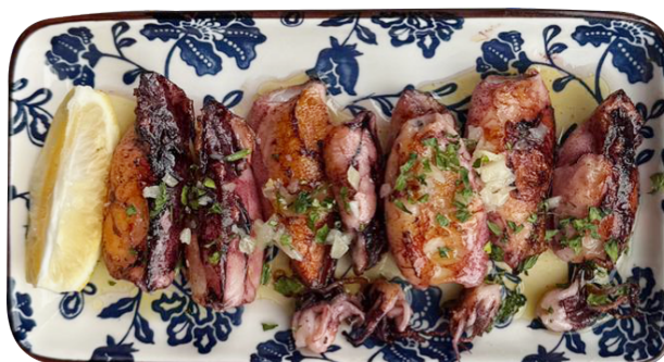
CALAMARES A LA PLANCHA 150g Lignje na žaru 680