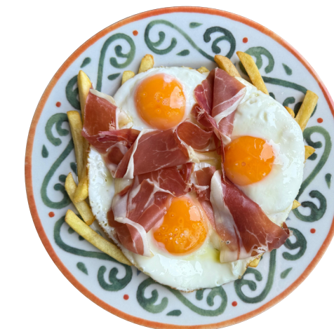
HUEVOS ROTOS CON PATATAS Jaja na oko sa pomfritom i španskom pršutom Jamón Ibérico Gran Reserva 620